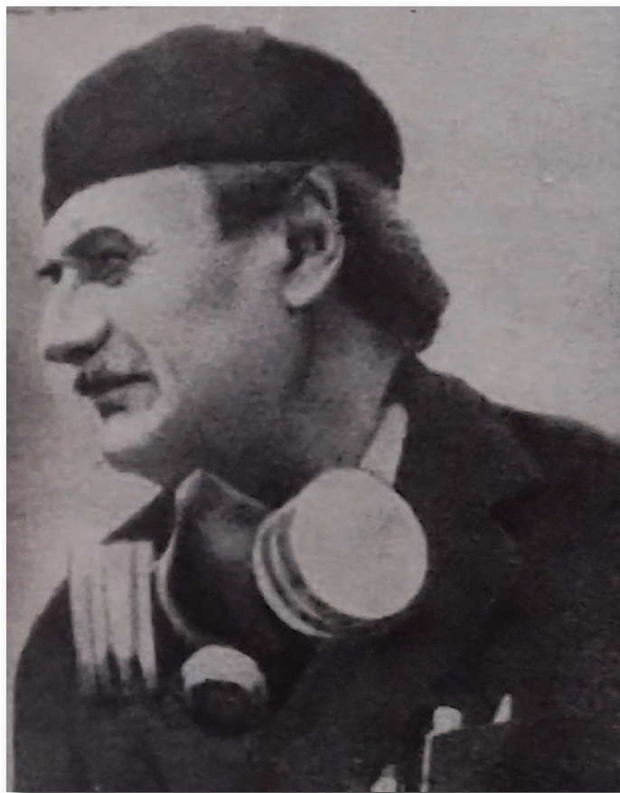
За матеріалами, наданими А. Новосельським, науковим співробітником Національного музею «Чорнобиль»

Фото 3. Режисер і головний оператор В. Шевченко. З книги І. Малишевського «Володимир Шевченко. Від Кулунди до Чорнобиля».