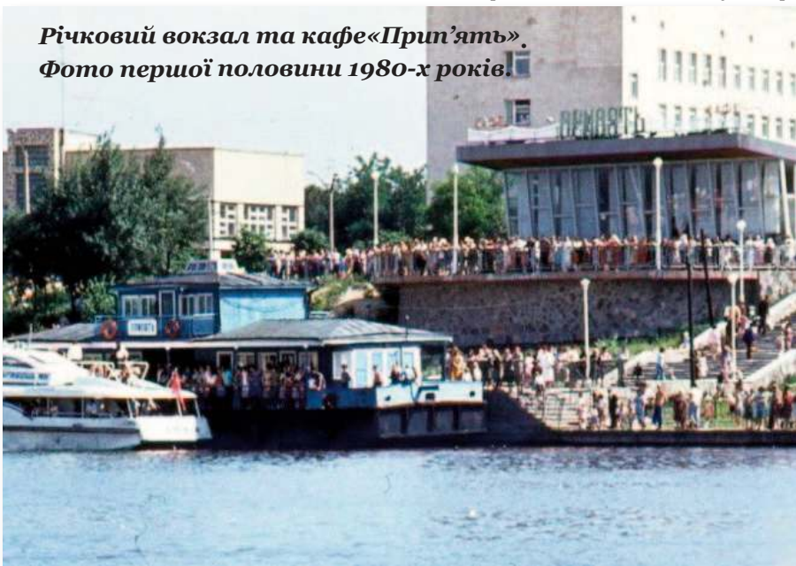
Річковий вокзал та кафе «Прип'ять». Фото першої половини 1980-х років.

Отже, у справі назви міста-супутника на першому місці природничий чинник, а саме перевагу надано значущому місцевому гідроніму.