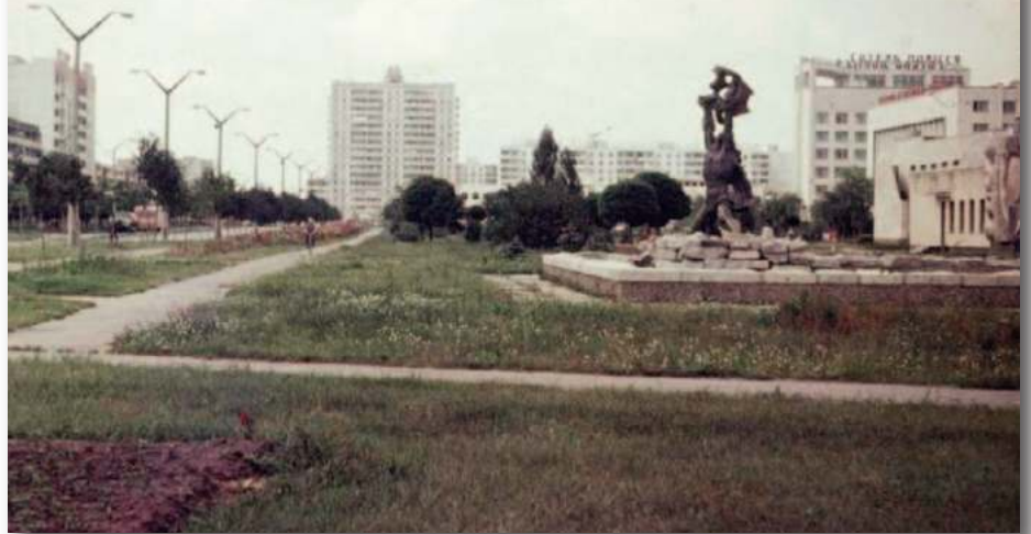
Кінотеатр «Прометей» та готель «Полісся» на дальньому плані. Фото першої половини 1980-х років.

атом, власне, триумф людського розуму, який його приборкав. Цікавим є й те, що у проектному завданні 1968 року у місті передбачався спортклуб з назвою «Уран».