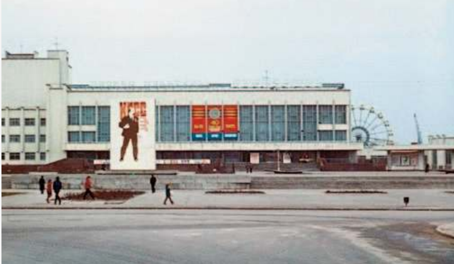
БК «Енергетик» та колесо огляду на дальньому плані. Фото першої половини квітня 1986 року.